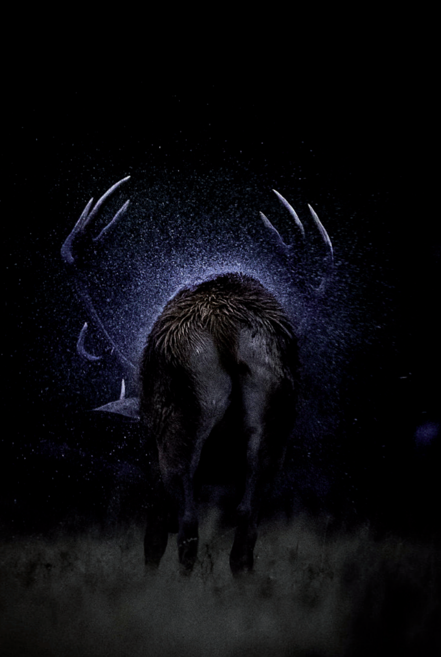
Cerf par temps de pluie.