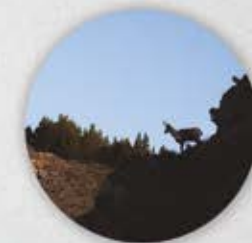
Isard Rupicapra pyrenaica