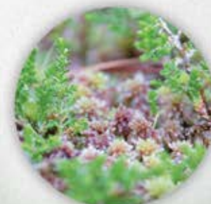
Sphaignes Famille des Sphagnaceae

9 Col de Portus - Au col, descendre la piste sur votre gauche. À la bifurcation, prendre à droite le même chemin qu'à l'aller jusqu'au parking.