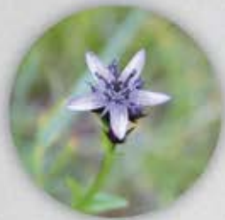
Swertie vivace Swertia perennis