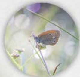
Fadet de la mélisque Coenonympha glycerion