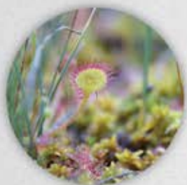
Droséra à feuilles rondes Drosera rotundifolia

1 Montellà - Stationnez au parking et empruntez le chemin qui monte sur la droite avant les murettes qui signalent l'entrée de la réserve.