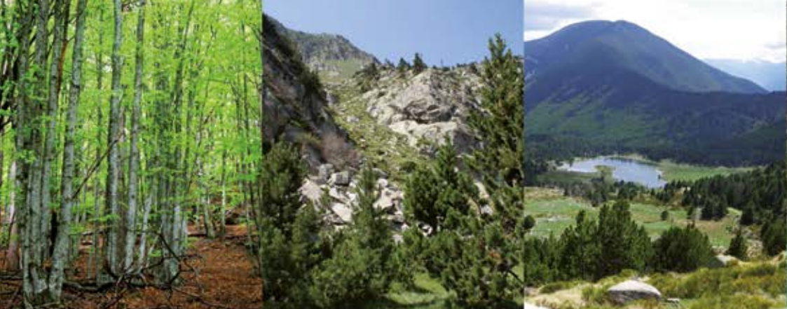
Réalisation FRINC 2018.