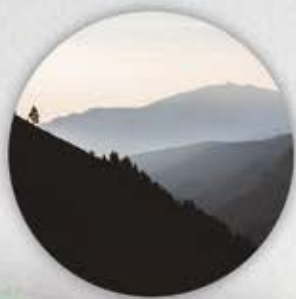
Pic du Canigou vue du point 8